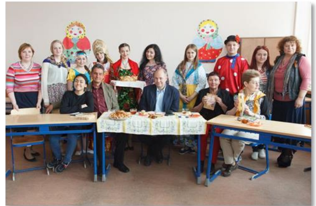
Schülerprogramm „Russische Kultur“

Kommunikations- und Informationstechnik Feinwerktechnik – Kältetechnik – Uhrentechnik Medien- und Veranstaltungstechnik Mechatronik – Goldschmiede